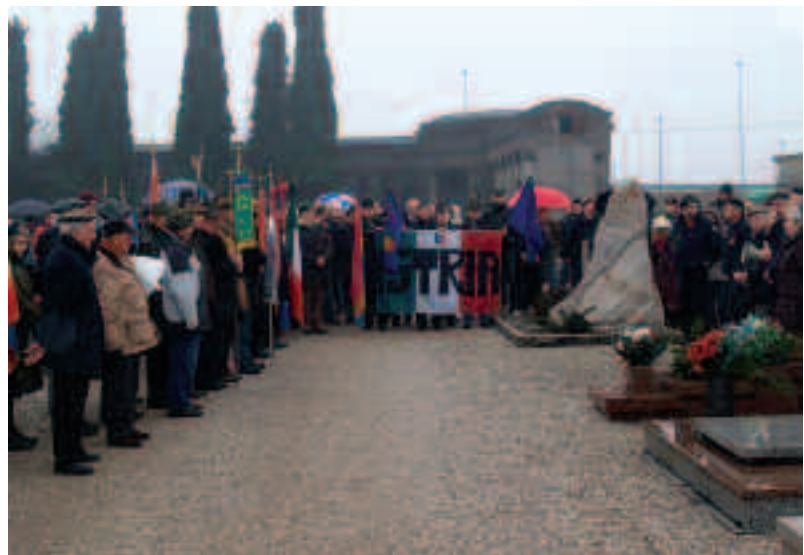
I partecipanti alla cerimonia al cimitero. In fondo il tricolore con la scritta ISTRIA