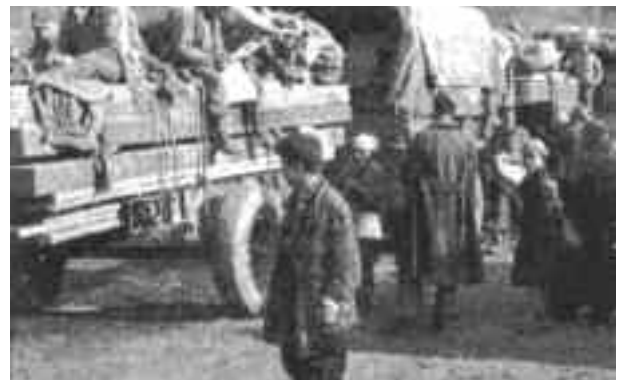
Napoli 1944: bambini affamati implorano un po' di cibo ai soldati americani.

Quando uscì, nel 1949, fLa pelle f ebbe un successo di pubblico clamoroso. Tradotto in tutte le lingue vendette milioni di copie. (...) Affascinante, elegante, raffinato e mondano conquistò anche il cuore di Virginia Agnelli, la madre dell'Avvocato. (...) Piacione f, ribaldo, opportunista e non di rado meschino, Malaparte fu però un vero italiano, anzi un arcitaliano f, come lo definisce Giordano Bruno Guerri. Incoerente per vocazione e calcolo sapeva però apprezzare la coerenza altrui. E questo spiega perché ne fLa pelle f uno degli episodi più belli, e scritto con passione, è quello della fucilazione di alcuni giovani fascisti, poco più che adolescenti, sul sagrato della chiesa di Santa Maria Novella a Firenze. Stanno per morire, ma si sforzano di essere sfrontati e beffardi e di mantenere, in un'Italia che l'aveva persa, la loro dignità ormai fuori corso. Quel che mi dispiace -dice a voce alta uno di loro- gli è d'essere ammazzato da quei bucaioli f. E si capisce che al maledetto toscano Curzio Malaparte sarebbe garbato f moltissimo se a pronunciare quella frase fosse stato lui.