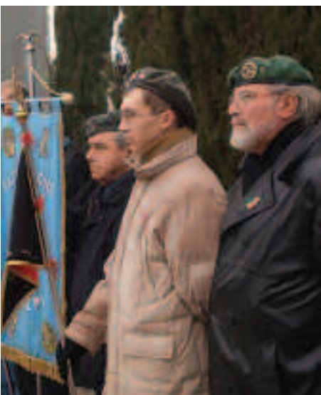
Tra due veterani un giovane "il futuro"