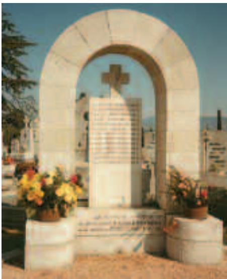
Tomba di 13 militari italiani assassinati nel 1944