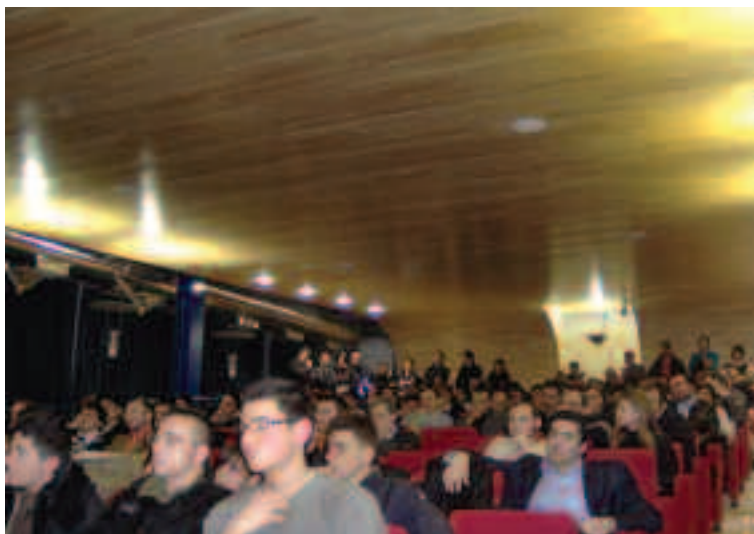
La sala delle conferenze della Biblioteca Provinciale di Foggia

A.S. Coordinamento regionale domenica 14 gennaio 2007