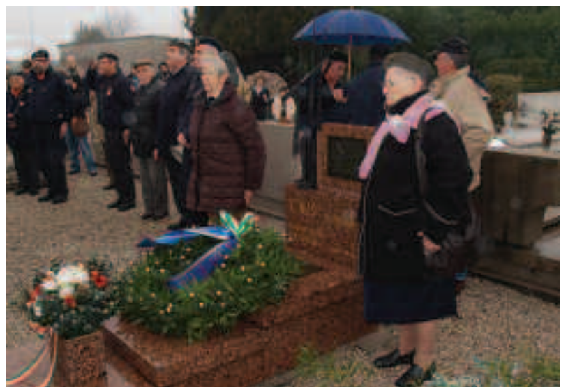
Il cenotafio nel cimitero di Gorizia dedicato ai reparti della Decima su iniziativa dei veterani del Battaglione Fulmine