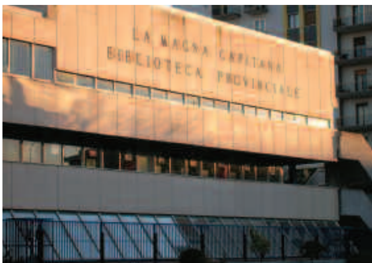
La facciata della biblioteca