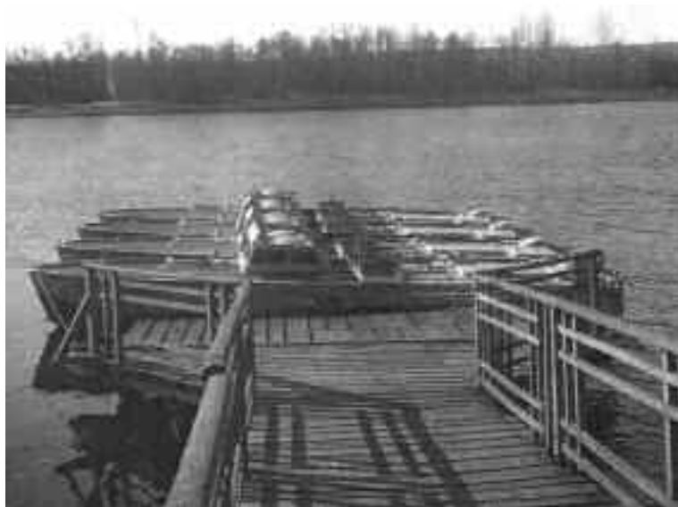
MAS in sosta a Sesto Calende

In altra pagina la descrizione dell'assalto al porto di Alessandria d'Egitto, nella selezione dal READER'S DIGEST dell'ottobre 1958.